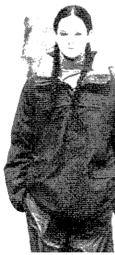
[그림 11] Sportmax (Collezioni Donna, No.71, p.168)

가지 대조적인 색상을 사용하여 시각적으로 효과가 강한 coordination을 많이 사용하고 있음을 알 수 있다.