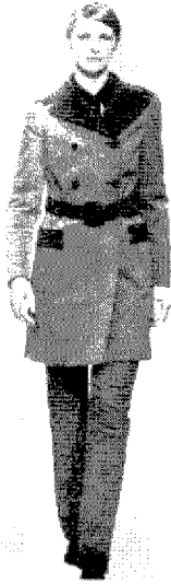
[그림 16] Moschino (Vogue, Vol.189, No.2, p.279)