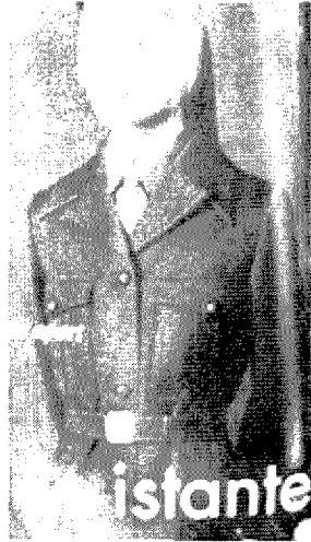
[그림 7] Istante (Vogue, Vol.186, No.9, p.284)