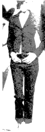
[그림 23] Alberta Ferretti (Collezioni, No.50, p.60)