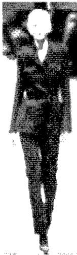
[그림 12] Trussardi (Collezioni Donna, No.52, p.58)