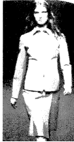
[그림 18] Prada (Collezioni, No.67, p.86)

Gorgeous image는 화려함과 성숙함 등의 의미가 내포된 이미지로 (그림 21)의 떼에 방띠네(Ter et Bantine)의 2000년 FW 컬렉션에서 화려한 red계열의 가죽으로 된 정교해 보이는 skirt suit를 선보였는데 색상에서 느껴지는 화려함과 Chinese collar, buttoned pocket, belt 등으로 한층 성숙한 이미지를 더해준다. Primitive image는 원래 의복의 기본구조나 형식에 얽매이지 않는 자연스러움이 배