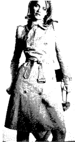
[그림 8] Prada (Collezioni Donna, No.52, p.52)