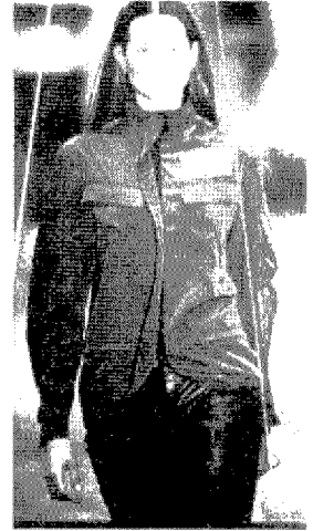
[그림 19] John Richmond (Collezioni, No.74, p.203)

어있는 이미지인데 미우 미우(Miu Miu)의 2000년 FW 컬렉션에서 dark brown 셔츠드레스를 자연스럽고 꾸미지 않는 듯한 밀리터리 룩을 선보였다(그림 22). 그 외 알베르타 페레티(Alberta Ferretti)의 1996년 SS 컬렉션에서는 blue 계열의 색상들을 조합하여 buttoned pocket이 특징인 매끄러운 느낌의 jacket과 jean pants를 매치하여 일반적인 밀리터리 룩과는 다른 이외적인 소재를 사용하여 pop image의 밀리터리 룩을 표현하였다(그림 23).