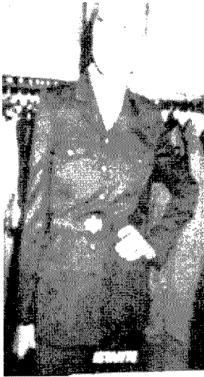
[그림 1] Istante (Vogue, Vol.186, No.7, p.48)