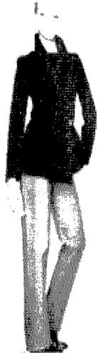
[그림 10] Prada (Vogue, Vol.186, No.7, p.153)