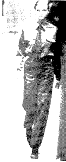
[그림 17] Trussardi (Collezioni Donna, No.52, p.58)

들이 tone-on-tone coordination으로 배색되어 남성적인 성향이 강해보이는 세련된 dandy image의 밀리터리 룩을 표현하였다(그림 17).