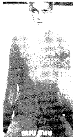
[그림 20] Miu Miu (Vogue, Vol.187, No.2, p.113)

이처럼 밀라노 컬렉션의 밀리터리 룩의 패션이미지는 그 종류에 있어 매우 다양하게 나타났는데, 이는 당시 패션 트렌드의 영향과 의외적인 요소들을 결합시키는 디자이너들의 창의적인 시도를 통해 밀리터리 룩이 좀 더 흥미롭고 실