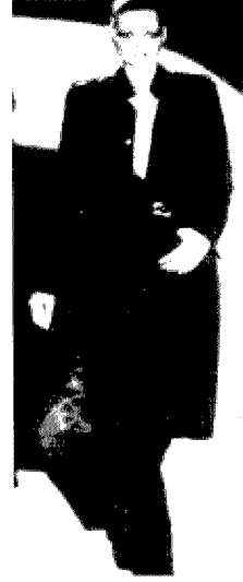
[그림 3] Gucci (Collezioni Donna, No.53, p.52)