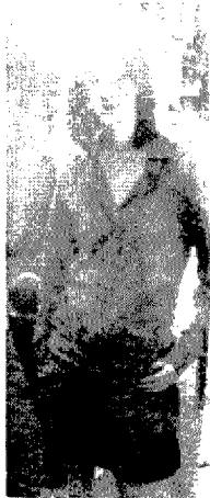
[그림 22] Miu Miu (Vogue, Vol.191, No.2, p.156)