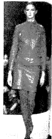
[그림 21] Ter Et Bantine (Collezioni, No.77, p.206)