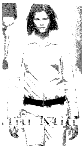
[그림 4] Miu Miu (Collezioni Donna, No.67, p.88)

이 가운데 black과 white는 1996년과 1997년부터 서서히 시작한 무채색의 유행(이재진, 2000)에 영향을 받은 것으로 생각되며 이러한 현상이 밀리터리 룩에도 반영되었다는 것을 알 수 있다. 전형적인 밀리터리 색상으로 볼 수 있는 brown, blue, olive range의 색이 밀라노 컬렉션의 밀리터리 룩에서 많이 나타났다. 이 가운데 brown이 가장 높은 빈도를 보여 밀리터리 룩의 대표적인 색상이라 할 수 있었으며 그 다음을 이어 blue와 olive색이 또 다른 밀리터리 색으로 black과 white 다음으로 자주 사