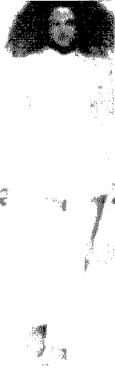
[그림 2] Paola Frani (Collezioni Donna, No.53, p.26)