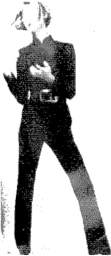
[그림 13] Gucci (Vogue, Vol.186, No.10, p.293)