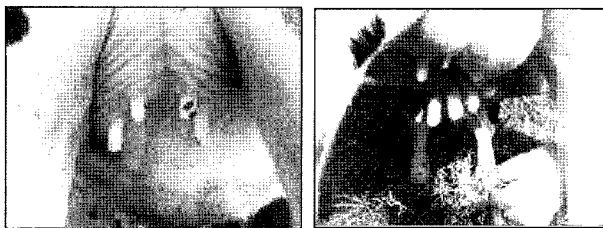
Fig 1. Udders and teats of 5-months of transgenic calf before (left) and after (right) artificial induction of lactation.

유기 비유된 우유와 정상 분만한 성우의 초유를 비교하기 위하여 육안검사와 Colostrometer™ (Biogenics Co., USA)을 이용하여 비중을 측정하였다. 채취된 우유는 냉동상태에서 원심분리를 실시하여 유청을 분리하고 우유 중 인간 lactoferrin의 존재 유무는 SDS-PAGE 방법(21)으로 확인하였