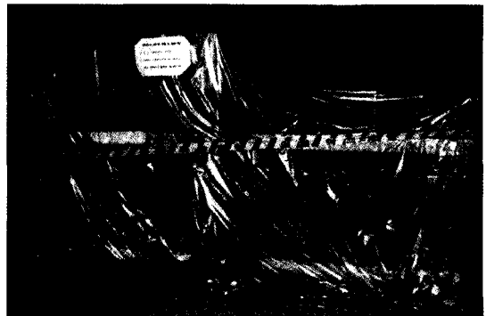
Figure 1. Concrete waste for self-disposal

이 콘크리트 블록 표면의 주요 방사선원은 주로 ^{234}\text{U} , ^{235}\text{U} 및 ^{238}\text{U} 으로서 우라늄의 농축도는 천연(0.711w/o) 또는 5 w/o 이내의 농축 우라늄이며, 화학적 형태는 \text{UO}_2 또는 \text{U}_3\text{O}_8 형태를 가진다.