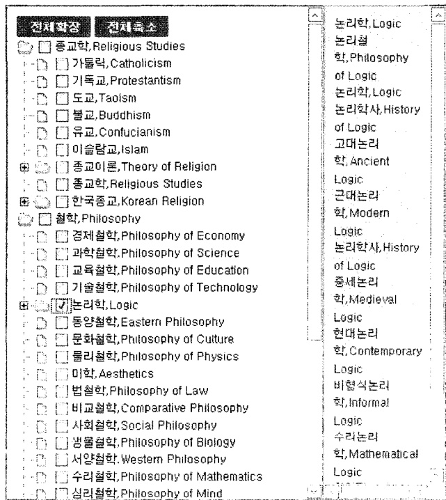
〈그림 3〉 철학·종교학 도메인 온톨로지 주제분류