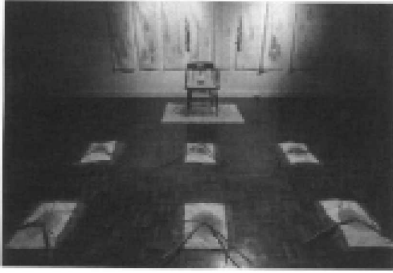
도 2. FX Harsonc, (Power and Oppression), 1992.