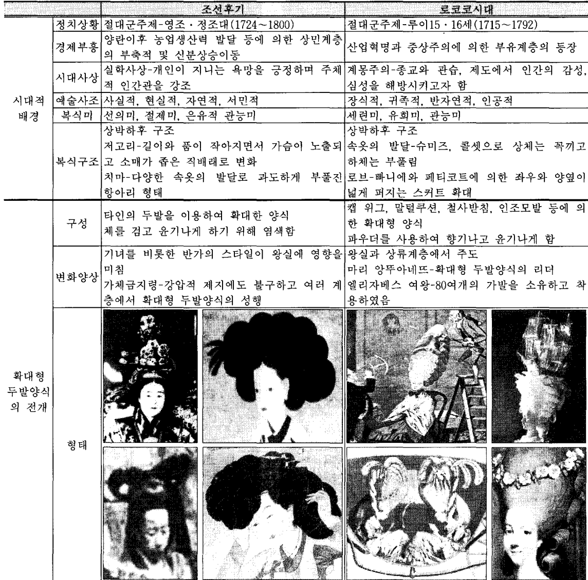
<표 1> 조선후기와 로코코시대 확대형 두발양식의 전개

몬드를 박은 것을 머리의 밑에 집어 넣어서 두피를 굽기도 하였다. 42)