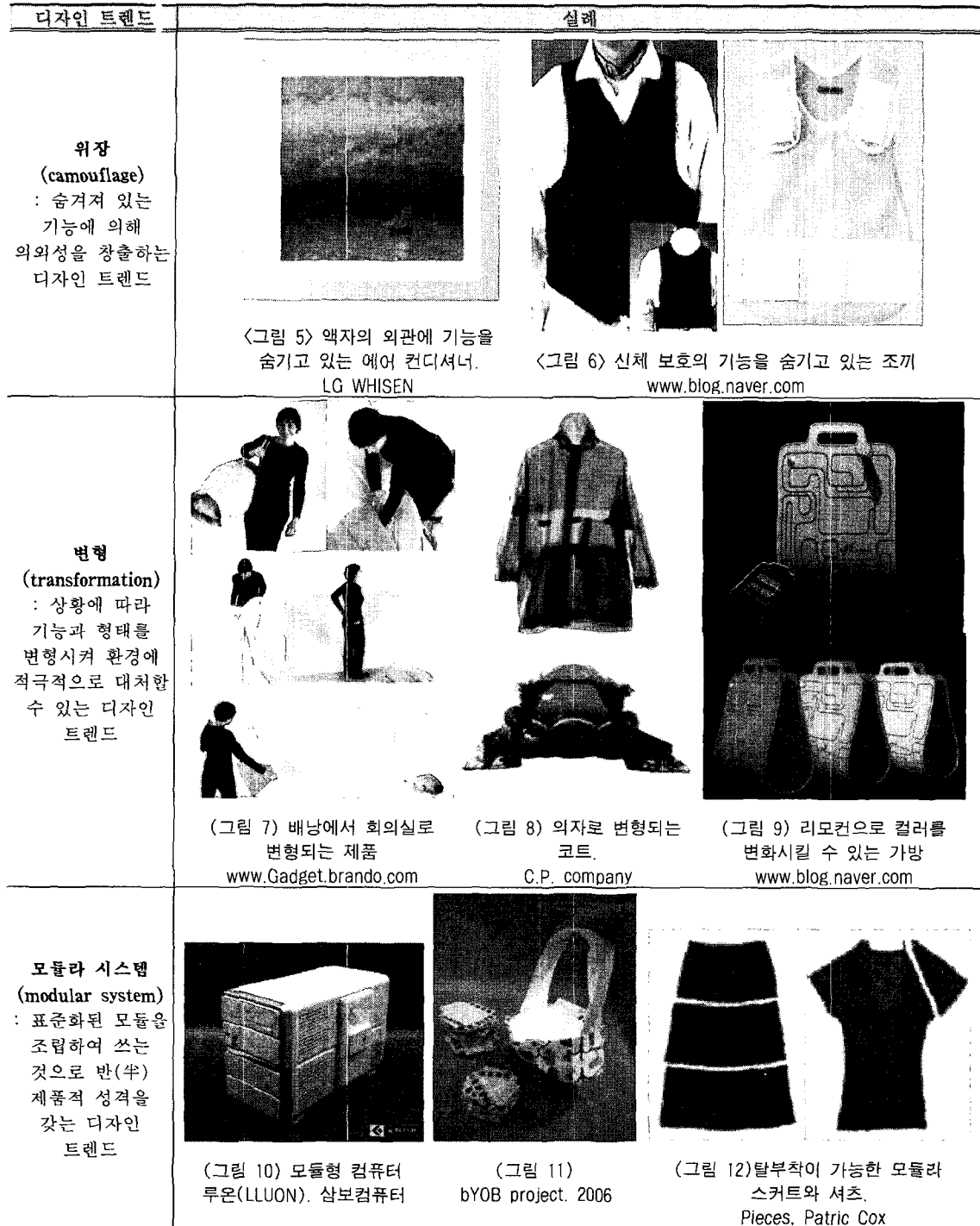
<표 2> 디자인 트렌드