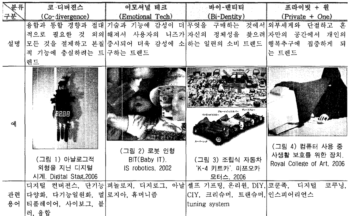
<표 1> 메가 트렌드