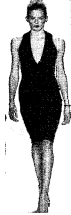
〈그림 12〉 Narciso Rodriguez, 2003 F/W(Vogue Korea, 2003. 5)