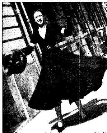
<그림 3> Christian Dior, 1947 (La petite robe noire, p. 21)