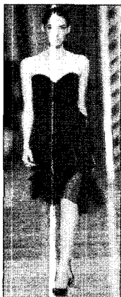
〈그림 18〉 Lanvin, 2005 F/W (W Korea, 2005. 5)

〈그림 20〉은 여성 인체의 곡선미를 살려서 품위 있고 엘레강스한 분위기를 표현한 블랙드레스이다. 이러한 엘레강스의 여성적 코드에 따른 움직임은 경쾌하고 유연하며 생기 있는 곡선적인 것으로 여성인체의 섬세하고 유기적인 완곡선, 울동감 있는 곡선 모두를 포함하며 이는 의상에 생기를 불어넣는 리듬이란 요소와 관계된다. 36) 경쾌하고 생기 있는 리듬의 표현은 엘레강스의 생기 있는 형태와 조화성을 이루는 요소임과 동시에 블랙드레스의 여성성을 강조하게 된다.