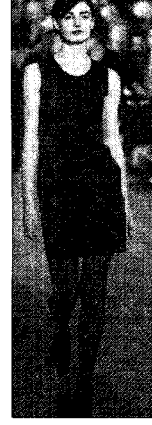
〈그림 13〉 Helmut Lang, 2001 F/W (L'Officiel, 2001. 5)

〈그림 12〉는 간결한 조형적 라인의 추구하고 세부 장식의 최소화, 액세서리의 배제에 의한 간결성 등 단일 색상인 블랙만으로 단순성을 추구한 블랙드레스로 밀착된 형태로 인해 여성의 인체는 여과 없이 노출되어 시크하고 모던함의 극치를 보여준다. 특히 광택 없는 블랙 소재는 완벽한 재단과 봉제로 디자이너가 추구하는 완벽한 실루엣을 표현해 낼 수 있으며, 신축성 있는 무광택 소재를 이용하여 기능성을 추구하거나 지적이고 현대적인 스타일의 블랙드레스로 연출할 수 있다.