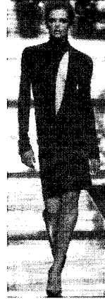
〈그림 16〉 Versace, 2004 F/W (L'Officiel Paris, 2004. 8)