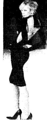
〈그림 17〉 Dolce & Gabbana, 2001 S/S(La petite robe noire, p. 64)

프랑스 출신 디자이너 롤란드 뮈레(Rolande Muree)가 "블랙드레스를 입은 여인은 퇴폐적이며 네글리제다." 30) 라고 리틀 블랙드레스의 관능적인 매력에 대해 이야기 했듯이, 노출을 통한 관능미의 표현은 인간 내면의 자유에 대한 갈망을 구사하고 육체를 있는 그대로 표현함으로써 에로틱한 관능미를 부여한다. 〈그림 15〉와 같이 투명소재인 오간자나 시폰을 단독으로 사용한 시스루의 블랙 드레스는 신체를 엿보는 훔쳐보기의 양태로 완전한 노출보다도 더욱 자극적인 관능성을 느끼게 한다.