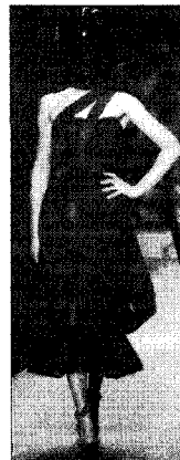
<그림 23> Victor&Rolf, 2005 S/S (W Korea, 2005. 1)