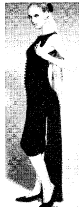
<그림 9> Chanel, 1995 F/W(Icona of fashion, p. 41)