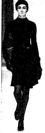
〈그림 11〉 Samsonite Black Label, 2001 F/W(L'Officiel, 2001. 5)