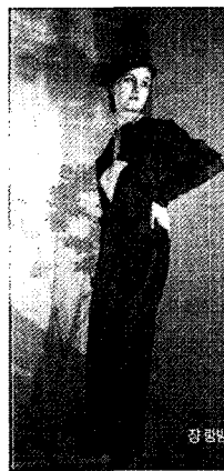
<그림 2> Elsa Schiaparelli, 1930 (Harper's Bazaar, 2006.1)