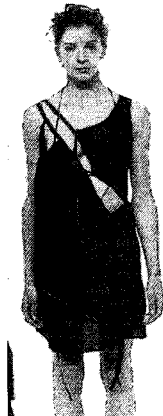
<그림 24> Hussein Chalayan, 2002 S/S(L'Officiel, 2001. 12)