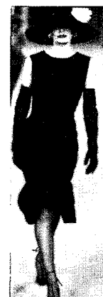
〈그림 20〉 Yves Saint Laurent, 2000 F/W (L'Officiel, 2002. 4)