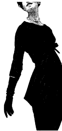
<그림 4> Balenciaga, 1956(La petite robe noire, p. 23)