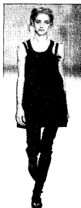
〈그림 19〉 Anna Molinari, 2003 S/S (Fashion Insight, p. 52)