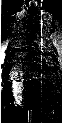
〈그림 10〉 Issey Miyake, 1993 S/S (La petite robe noire, p. 49)