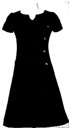
<그림 6> Courreges, 1965 (La petite robe noire, p. 69)