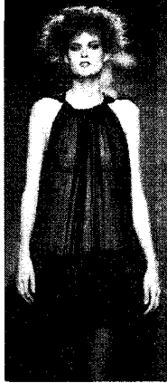
〈그림 15〉 Salvatore Ferragamo, 2002 S/S (L'Officiel, 2001. 12)