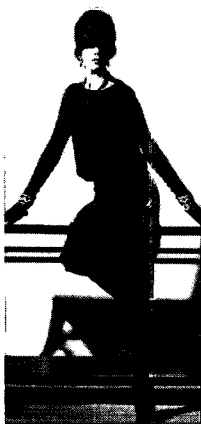
<그림 1> Chanel, 1926(Chanel, p. 40)

1944년 미국 보그지는 '10명의 여성 중 열명이 리틀 블랙드레스 하나는 반드시 가지고 있지만 그들은 모두 또 다른 리틀블랙드레스를 원하는데 왜냐하면 블랙드레스가 라이프스타일에 가장 적당하기 때문이다. 분위기, 장소, 때에 따라 완벽하게 변한다. 가장 높은 시크를 가지고 있으며 계절과 상관없이 수명이 길다.' 10) 고 지적한 것 처럼 자유와 현대성의 표현이라는 탄생 당시의 의미와 가치가 시간의 흐름에 따라 달라져 새로운 미적가치와 특성