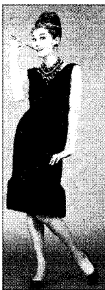
<그림 5> Givenchy, 1960 (Icona of fashion, p. 41)

1970년대에 들어와 패션은 공식적인 규범에 대해 자유롭고 여유로운 해방된 라이프 스타일을 표현하게 되었고 다양한 스타일의 혼재를 보이며 생활의 한 부분으로 정착하게 되었다. 이러한 분위기 아래 리틀 블랙드레스는 복고적 취향의 성숙한 분위기나 반항적인 아방가르드한 분위기의 특성을 나타내었다.