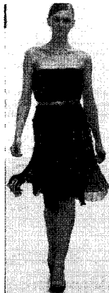
<그림 22> Balenciaga, 2005 F/W(Vogue Korea, 2005. 5)