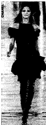
<그림 21> Chanel, 2005 F/W (W Korea, 2005. 9)

특히 현대패션에서 표현되는 이러한 불확정적인 구조는 착용에 따라 변화하는 창조적 자율성을 부