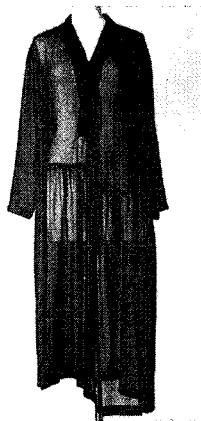
<그림 7> Comme des Garçons, 1987(La petite robe noire, p. 33)