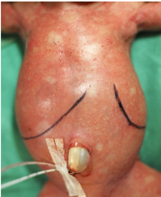
Fig. 1. Abdominal distension due to hepatosplenomegaly is observed.

말초혈액 검사상 백혈구수 21,760/mm 3 , 혈색소 7.7 g/dL, 적혈구 용적률 23.3%, 혈소판 44,000/mm 3 이었고, 동맥혈 가스 분석상 pH 7.275, pCO 2