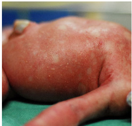
Fig. 2. Erythematous rash with multiple vesicle on the trunk is observed.