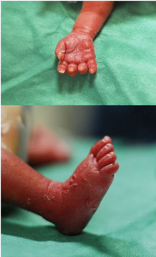
Fig. 3. Desquamation on right palm and multiple vesicles with desquamation on right foot are seen.