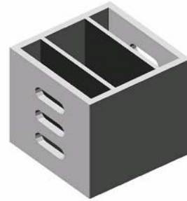
그림 1. 제작된 박스모형

그림 1은 본 연구에서 고안한 박스크기 및 손잡이위치에 따른 박스모형(mockup)이다.