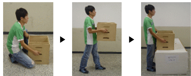
그림 3. 들기, 옮기기, 내려놓기 동작에 대한 실험장면 (바닥에서 허리높이로 옮기는 예)

그림 3은 피실험자가 박스모형을 들어서, 5m 떨어진 위치로 옮기고, 내려놓는 동작을 보여준다. 천공된 손잡이의 사용 순서는 상부, 중앙, 하부손잡이 순서대로 실험하게 하였으며 박스 이동위치는 상기에서 열거한 순서대로 바닥→바닥에서 시작하여 허리높이→허리높이 까지를 차례로 실시하였다. 두 번째 반복되는 실험은 역순(reverse ordering)으로 실시하게 하였는데 이와 같은 실험조건 설정의 목적은 cross-balancing을 하여 혹시 발생할 primacy와 recency 효과를 제거함으로써 측정 자료의 정확성을 높이기 위함이다. 또한 이러한 reverse ordering은 앞서 언급한 바와 같이 피실험자의 피로와 적응효과를 감소시킬 수 있다고 판단된다.