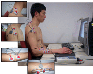
그림 1. EMG 측정대상 근육의 Electrode 부착 위치