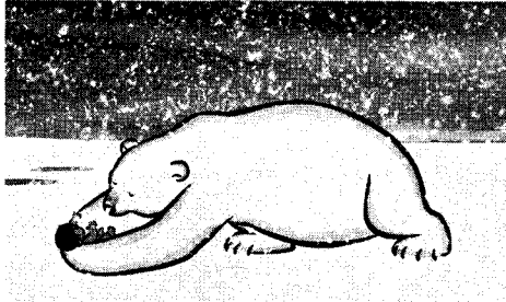
그림 4. 애니메이션 <곰이 되고 싶어요> 중에서

신화가 인간의 삶과 죽음, 그 운명에 대한 가장 풍요로운 은유라면, 그동안 한국 애니메이션은 공간적 배경으로서의 신화적(혹은 환상적) 공간만을 차용했을 뿐, 신화적 사유 공간으로서의 주제와 공간은 확장시키지 못하였다. 그러나 장소는 과거이고 역사이다. 이와 관련하여 미야자키 하야오는 “경계없는 시대에 설 장소를 가지지 못한 인간은 가장 경시될 것이다. 장소는 과거이고 역사이다, 역사를 가지지 못한 인간, 과거를 잊은 민족 또한 덧없이 사라지거나 가축이 되어, 잡아먹힐 때까지 알을 낳을 뿐인 닭과 같은 운명을 맞을 거라 생각한다”[14]고 말한 바 있다. 결국, 단순히 배경적 의미에서 신화를 바라본다면 애니메이션은 그야말로 시각적 스펙타클로만 관객의 눈을 현혹시키는 오락으로서의 수단에 머물고 말 것이다.