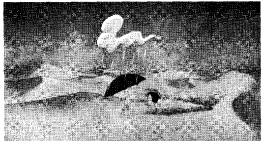
그림 1. 이무기가 있는 곳으로 오늘이를 안내하는 구름동자, 애니메이션 <오늘이>중에서

진리는 동양적 관점에서 볼 때 도를 깨닫는 과정 즉, 우화등선(羽化登仙:사람의 몸에 날개가 돋쳐 하늘로 올라가 신선이 된다는 의미)을 위해 얻어져야 하는 본질적 요체이다. 이는 서양에서 '현자의 돌'을, 여타의 동양 설화에서는 '단약(丹藥)'을 얻는 과정을 통해 초월적 존재가 되는 과정과 흡사하지만 <오늘이>는 '현자의 돌'도 '단약'도 아닌, 눈에 보이지 않는 지혜를 얻어감으로써 자기 존재의 근원을 찾게 된다.