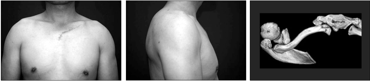
Fig. 3. Follow up photo one year after the operation: Successful correction of the bony prominence at the left medial clavicle. (Left: frontal view, Center: lateral view) (Right) Complete regeneration of the anterior cortex of the resected area of the clavicle(p: posterior head, H: humerus).

한 이차 변형으로 생각되어 진다. 과거에는 거의 모든 쇄골 골절을 팔자붕대를 이용하여 보존적으로 치료할 것이 권장되었는데, 근래에는 합병증을 줄이기 위해 K-강선 고정술, 금속판과 나사를 이용한 내고정술 등 다양한 수술적 치료가 시행되고 있다. 2 쇄골 골절의 합병증으로는 부정유합, 신경혈관손상, 재골절, 외상 후 관절염, 및 불유합 등이 있다. 2 이러한 합병증들은 기능적 제한을 초래하거나 통증을 유발할 경우에 가골절제를 통한 감압술(decompression with callus excision), 신경박리술, 관혈적 내고정술, 절골술 등을 시행하여 치료되고 있다. 3 쇄골 골절은 주로 정형외과에서 다루는 분야로 부정유합으로 인한 미용적 문제가 발생하였더라도 통증이나 기능적 문제가 동반되지 않을 경우에는 대부분 수술적 교정을 시행하지 않았다. 본 교실에서는 환자가 돌출된 좌측 흉쇄골 관절의 미용적 문제를 호소하여 컴퓨터촬영상 쇄골의 내측두가 부정유합에 의해 나누어지고 돌출되어 있는 것을 확인하고 내측두의 전방에 있는 골두를 절제하고 다듬어서 만족할만한 결과를 보였기에 이를 보고하는 바이다. 절제된 부위의 해면골은 피질골로 대체되었으며 일년이 지난 후 추적검사 상 좌