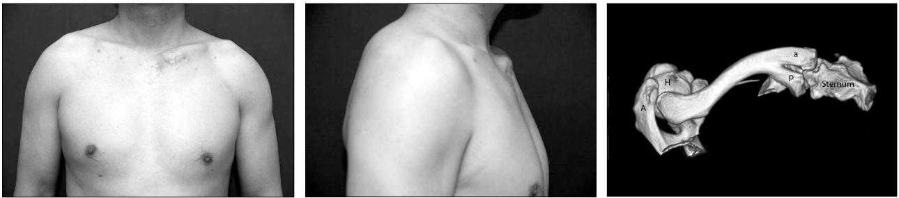
Fig. 1. Preoperative clinical pictures and three dimensional CT scan. (Left) Frontal view of a 41-year-old male patient showing a wide hockey stick shaped scar and a prominence at the medial half of his left clavicle, which was caused by a double-ended medial head. (Center) Lateral view of the patient. (Right) Three dimensional CT scan showing a split medial head of the left clavicle. The sternal joint surface is divided into two portions by a bony prominence (a: anterior head, p: posterior head, H: humerus, A: acromion).