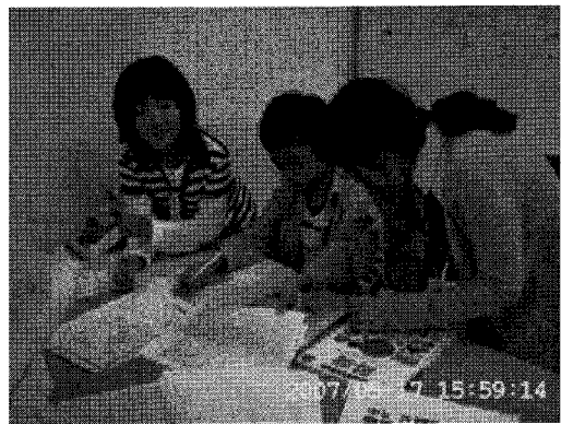
<그림 4> 지도 만들기 2