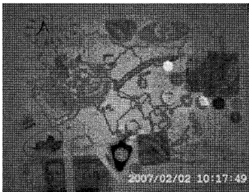
<그림 3> 지도 만들기 1