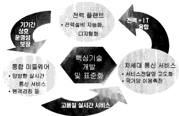
그림 2. 기술개발 추진목표

본 과제의 최종목표는 전력설비의 지능화 및 디지털화를 구현하는 21세기 선진형 smart 전력시스템에 기여하고자 전력선통신기술을 이용한 유비쿼터스 전력통신망 기반을 확립하는 것이다. 즉 기 개발된 24(Mbps)급 모뎀의 안정화와 200(Mbps)급 초광대역 PLC 전송기기와 관련 기기 들을 개발하여 전력선망을 통신인프라로 운용할 수 있도록 전력선통신 기반 개방형 통합망을 구성한다.