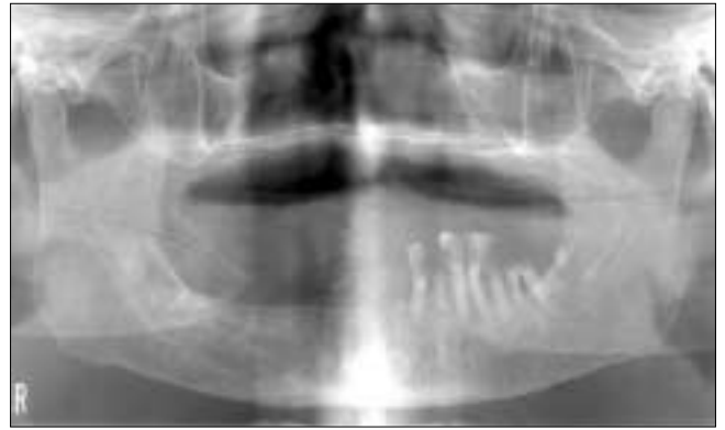
Fig. 1. Initial finding showed recent extraction site on right mandibular third molar and multiple retained roots on the left mandible. Faint images of drains were identified on the right retromolar area those inserted previously.

발치 후 이틀이 지난 후부터 붓고 아프기 시작하였으며 발치와에서는 농이 나왔다고 하였다. 임상 검사 시 우측 협측 부위와 경부에서 국소화된 발열(localized fever)과, 종창(swelling), 경결감(tenderness), 홍조(redness)를 보였다. 과거 병력 상 고혈압과 당뇨가 있었으며 FBS/PP2는 136/275 mg/dl이었고, 이에 대한 약물 치료 중이었다. 혈압은 131/90mmHg, 맥박은 1분당 100회, 호흡수는 1분당 20회, 체온은 36.5°c 였고, 혈액검사 상 백혈구의 증가( 24.1 \times 10^3/\mu\text{l} ), 늘어난 ESR(75 mm/hr), 증가된 hs-C-reactive protein(18.97 mg/dl)의 소견을 보였다. 흉부 방사선 소견은 basal atelectasis가 일부 관찰되었으며 악골의 Paronama 사진 상 우측 제 3 대구치의 발치와가 관찰되었고(Fig. 1), 컴퓨터단층촬영 결과 우측 악하공극(submandibular space), 설하공극(sublingual space), 부인두공극(parapharyngeal space), 전기관공극(pretracheal space)에 이르는 광범위한 농양과 함께 내경정맥의 혈전증을 관찰할 수 있었다(Fig. 2).