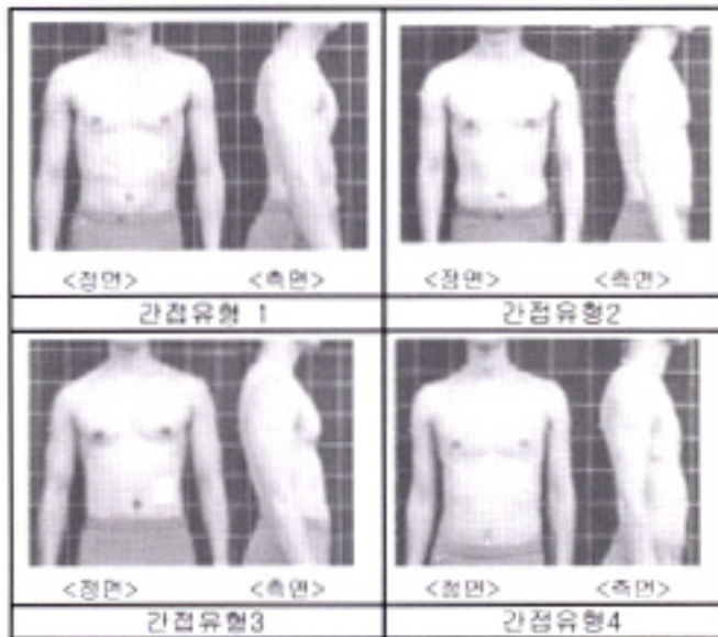
<사진 2> 간접치에 의한 유형별 정,측면 사진

대표체형 그룹을 선정하기 위하여 먼저 직접, 간접 형태를 나타내는 체형구성요인을 가중평균하여 다음식과 같이 측정방법 별 지표(Index)를 산출하였다.