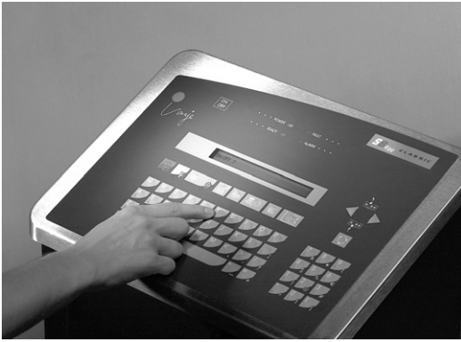
▲ 에그머신 기계