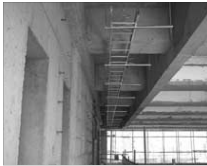
통신 CableTray 설치공사