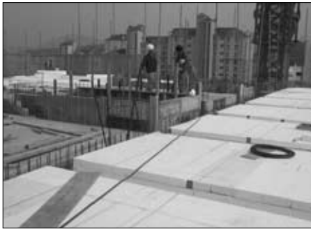
지붕층 거푸집 설치공사

또한 '06. 5.22일 개최된 제8회 위원회에서는 회관 2차 설계변경 용역계약을 위해 유진건축과 계약금액 및 용역범위에 대한 최종 협의를 거쳐 설계변경용역을 진행하기로 하고, 지표면 조정에 따른 토목옹벽설계는 우리협회에서 별도 발주하기로 하였다.