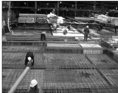
지하 1층바닥슬라브 철근배근