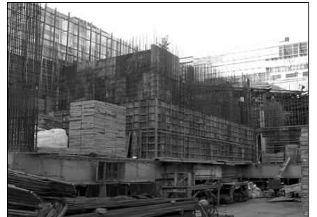
지하 1층부 벽체거푸집조립