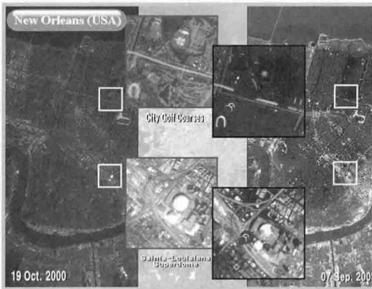
〈그림 4〉 아리랑 1호를 이용한 자연재해 감시(예)