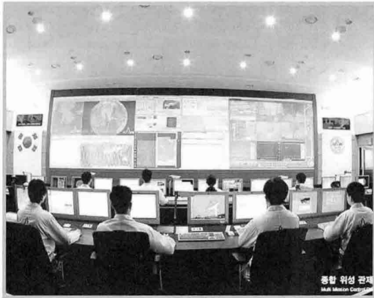
〈그림 3〉 아리랑위성 관제실