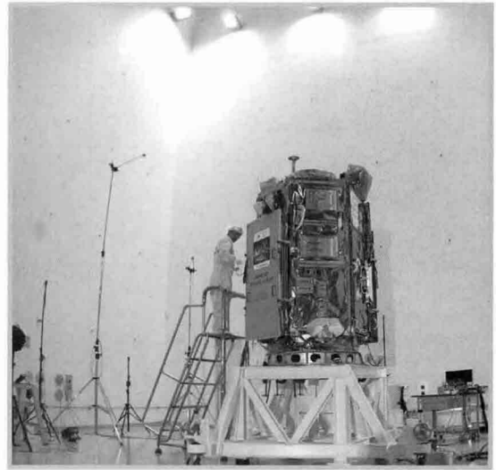
〈그림 5〉 음향 환경시험을 마친 아리랑 2호 모습