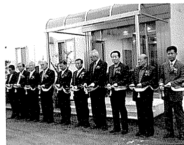
▶ 테이프 커팅식 장면.