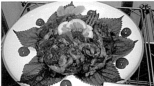
▶ 신선 셀덕 슬라이스를 매콤한 고추장 양념으로 가공한 제품.