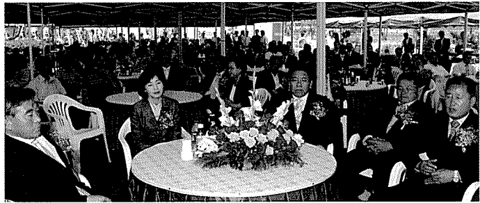
▶ 기념식에 많은 인사들이 참석하였다.