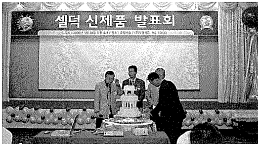
▶ 신제품 발표 축하 케익 커팅.

셀레늄은 우리 몸에 필수 미량원소로서 노화 지연, 면역기능 증강, 중금속 공해 예방, 성인병치료와 예방에 탁월한 물질로 주목받고 있다.