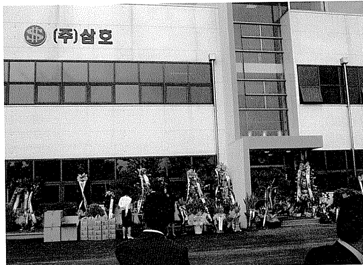
▶ (주)삼호유향오리 본사.