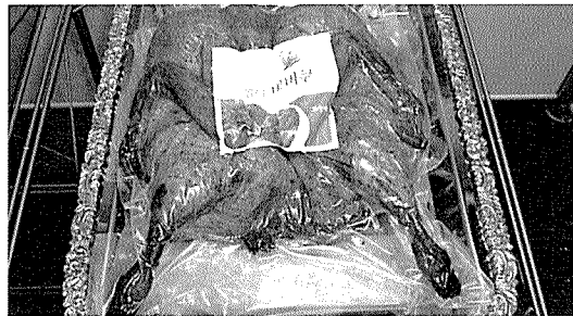
▶ 천연 양념으로 재어 직화해 구운 전통 바비큐.