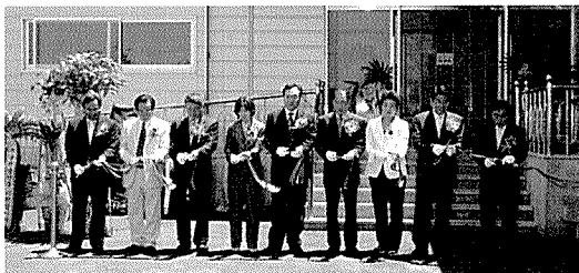
▶ 테이프 커팅식 장면.