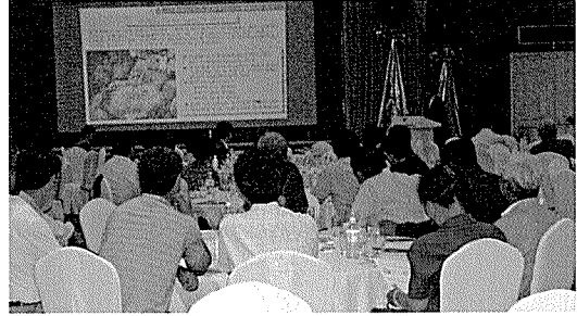
▶ 셀레늄과 오리고기의 효능에 관한 강연.