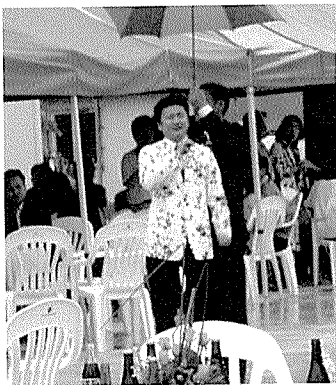
▶ 초대가수(현진우)의 공연 모습.

개업식 당일 비가 많이 내렸음에도 오리 및 축산관련 업체들과 유관기관 인사들이 대거 참석하여 축하하였으며 특히 인기 연예인(현진우) 초청 공연으로 흥겨운 시간을 가졌다.