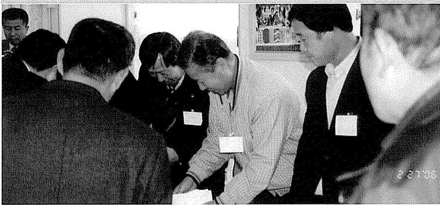
▶ 선거위원들의 계표작업이 이루어지고 있다.