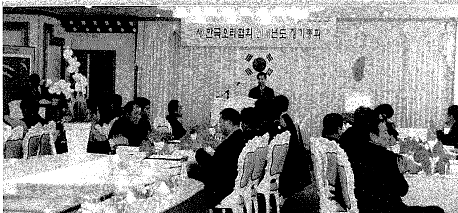
▶ 방화동 소재 궁전웨딩홀에서 개최된 제15차 정기총회 모습