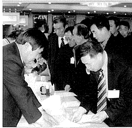
▶ 투표인단을 점검하고 있는 선거위원들.