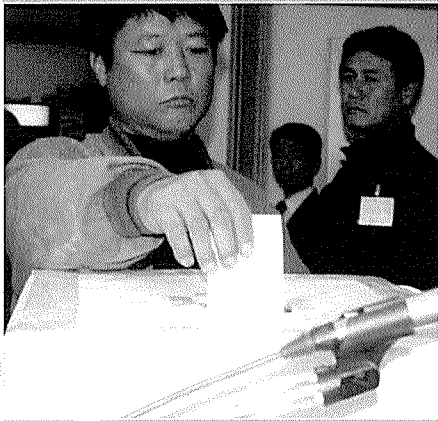
▶ 정기총회에 참석한 각지 회원들이 제8대 회장선거 투표에 참여하고 있다.