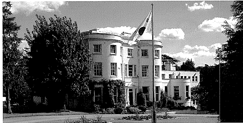
영국 첼트햄에 본사를 둔 스파이렉스사코

이 시스템은 고객정보를 실시간 수집하고 갱신하여 최신의 고객정보와 판매정보, 현장 및 시장정보를 관리하는 시스템으로서 고객가치 추구를 평가할 수 있어 고객서비스를 지속적으로 개선하도록 지원하는 시스템이다.