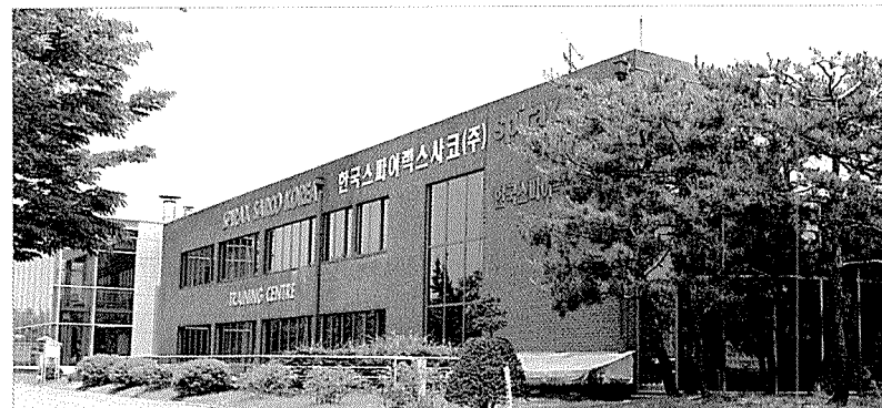
인천 남동공단에 위치한 한국스파이렉스사코