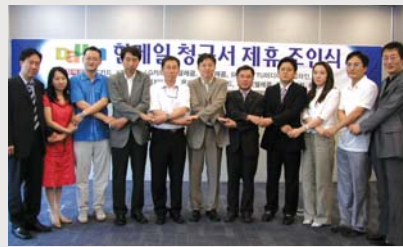
한메일넷 청구서함 제휴식

다음은 각 기업 사이트들 개별 방문 없이 한번에 원클릭으로 청구서를 신청·관리할 수 있는 한메일 <청구서함>서비스를 확대했다.