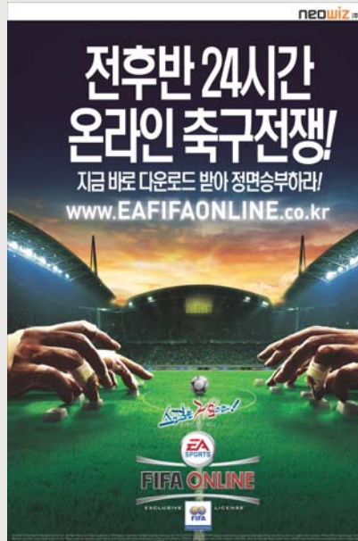
최단 기간 동접 15만명을 돌파한 피파 온라인

임 <피파 온라인>이 지난달 1일 오후 2시 동시접속자수 15만7,596명을 달성했다고 밝혔다.