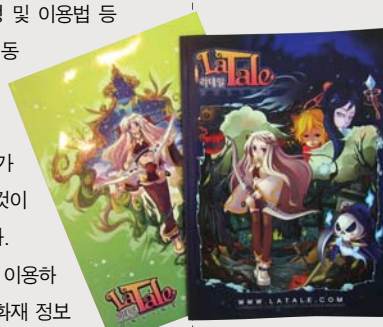
액토즈소프트의 <라테일> 공책

캐주얼 액션 RPG <라테일>은 귀엽고 깜찍한 그래픽과 간단한 조작법으로 특히 저 연령층 이용자들에게 인기를 얻고 있다.