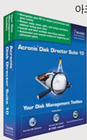
아크로니스 디스크 디렉터 스위트 10

아크로니스는 최근 디스크 파티션 관리 및 멀티 부팅 기능이 강화된 <아크로니스 디스크 디렉터 스위트(Acronis Disk Director Suite) 10>을 출시했다. <아크로니스 디스크 디렉터 스위트 10>은 사용자가 디스크 내에 파티션을 생성, 통합하며 파티션 구조를 탐색, 데이터 편집 등을 수행하는 ‘마법사 기능’이 새롭게 추가됐다. 특히 ‘아크로니스 OS 셀렉터’ 기능을 통해, 강력한 멀티부팅 환경을 만들어 한 개의 디스크 드라이브에 무제한적인 운영체제 설치가 가능하고, 동일한 파티션 내에 여러 버전의 윈도우 설치도 가능하다. 이를 통해 어떠한 파티션이나 드라이브에서도 시스템을 안정적으로 부팅 할 수 있다.