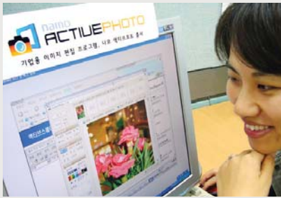
이미지 편집 SW 나모 액티브포토

세종나모가 지난달 3일 기업용 이미지 편집 소프트웨어 <나모 액티브포토>를 출시했다.