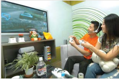
Xbox 360 휴가지 체험행사

한국마이크로소프트가 Xbox 360 롤링콘솔의 전국 순회 프로모션을 진행하는 한편, 국내 호텔 및 리조트에서 Xbox 360을 직접 체험할 수 있는 'Xbox 360 여름 축제(Xbox 360 Summer Festival)'를 지난달 20일부터 이 달 31일까지 순차적으로 진행한다.