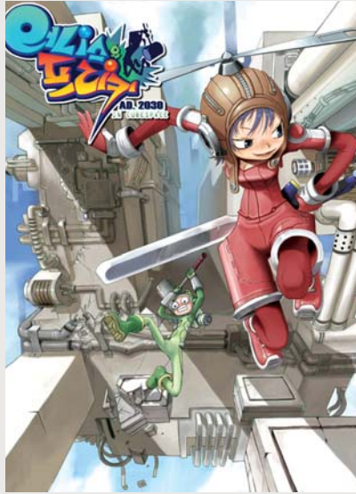
SF 코믹 어드벤처를 표방한 서기 2030 어니스와 프리키

진행된 이번 프리오픈에서는 세계의 인턴과 랭킹 시스템을 도입하고, 기존의 퀘스트와 맵 등을 수정, 보완해 다양한 재미를 선사했다.