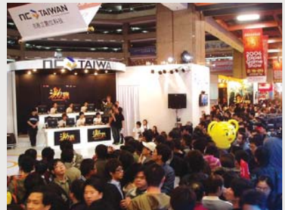
중국에서 개최된 제 1회 길드워월드챔피언십 경기

엔씨소프트의 대전온라인게임인 <길드워>가 IEF(International esports Festival)2006 시범종목으로 채택되어, 오는 9월 중국 상하이에서 한·중·일 대결이 펼쳐진다.