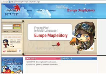
메이플 스토리 유럽 서비스 홈페이지 화면

넥슨은 자사의 인기 온라인게임 〈메이플스토리〉가 지난달 27일부터 유럽 지역에서 클로즈 베타 테스트에 들어갔다고 밝혔다.