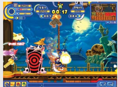
HINGSKROL 슈팅 액션 게임 <루디팡>의 한 장면

원디소프트는 지난달 20일 게임믹스에서 개발한 Hingskrol 슈팅게임 <루디팡>의 오픈 베타 테스트를 전격 단행했다.