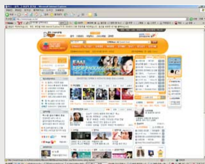
벅스 홈페이지 화면

벅스는 지난달 18일 온세통신과 무선인터넷 서비스에 관한 전략적 제휴를 체결하고 모바일을 통해 벅스의 콘텐츠를 이용할 수 있는 서비스를 올 연말부터 제공할 예정이다. 온세통신은 무선인터넷망 개발에 따라 SKT·KTF·LGT 등 이동통신 3사와 무선망 제휴를 맺고 개방형 모바일 인터넷 서비스인 <쏘원(So1)>을 상용화한 바 있다. 벅스의 이번 무선 인터넷 서비스 역시 <쏘원>을 통해 제공된다.