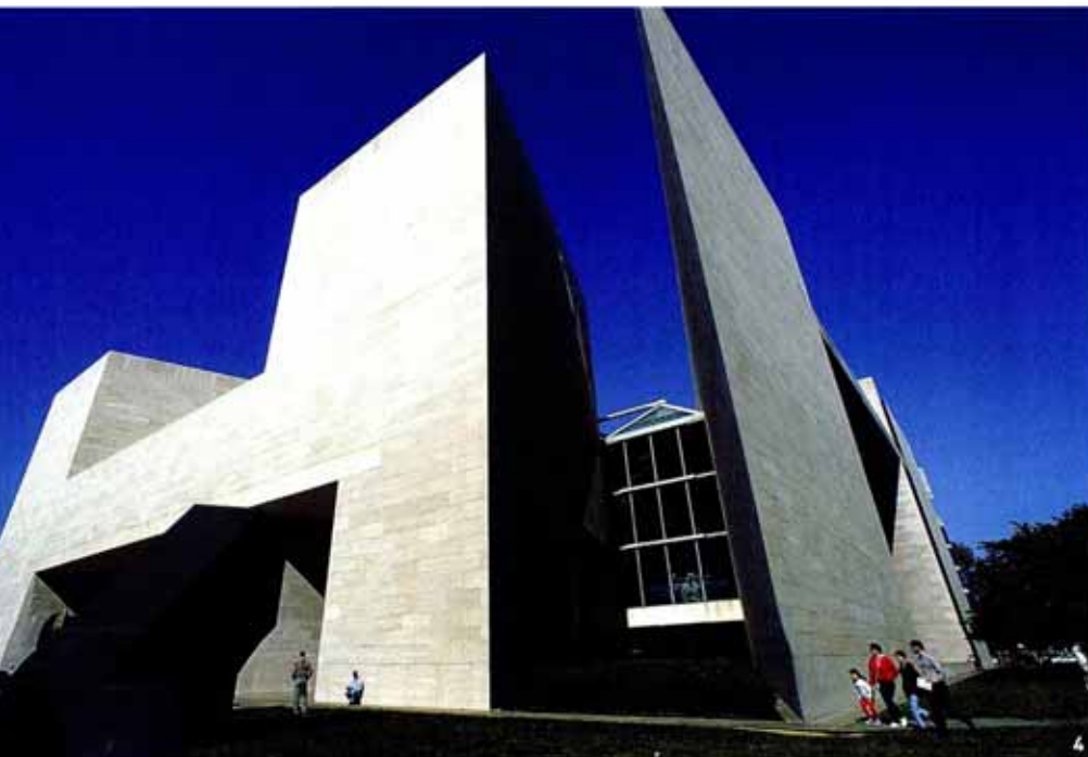
1 Ieoh Ming Pei & Partners, 루브르 박물관 입구의 피라미드, 1983-1987년. 파리. 2 Ieoh Ming Pei & Partners, 루브르 박물관 지하층으로 연결된 계단, 1983-1987년 파리. 3 Pei Cobb Freed & Partners, 루브르 박물관 Richelieu 동의 Puget 중정의 모습, 1983-1987년. 파리. 4 Ieoh Ming Pei, 국립미술관의 동관, 1968-1978년. 워싱턴 D.C. 5 Ieoh Ming Pei & Partners, 중국 타이완 뱅크, 1982-1990년. 중국, 홍콩.

• 전 세계 유명 건축물을 소개하고 있는(언더스탠딩 아키텍처(Understanding Architecture)). 1부에서는 공간의 개념, 비율에 대한 연구, 영토계획, 도시계획, 건물 타입과 스타일 등으로 유명한 건축물들을 분석하고 2부에서는 당대의 유명한 건축가들과 삶의 이야기로 이어진다. 이미 영어와 이탈리아 그 외 세계 여러 나라에서 출간될 예정인 <언더스탠딩 아키텍처>는 마로니어팩스에서 번역 출간될 예정이다. 참고로 이 글은 영어본을 참고했음을 밝힌다.