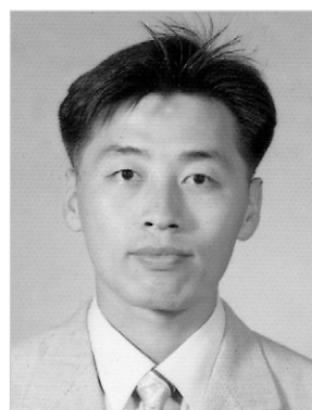
강 완 병 서울사료양계 특판

Issue Date: 10, 2006 | Issue 28 | Volume 78 (발행일 표시, 주간 단위 발표)