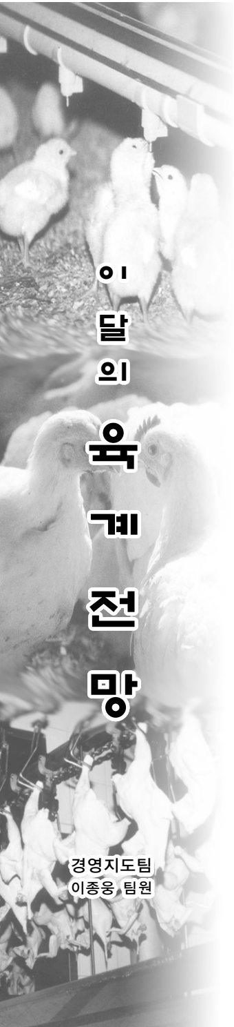
경영지도팀 이종웅, 팀원