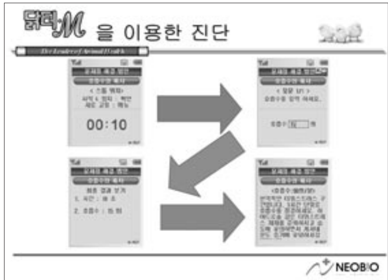
〈그림2〉 양계 핸드폰 시스템 <닭터-M>에서의 더위 스트레스 점검