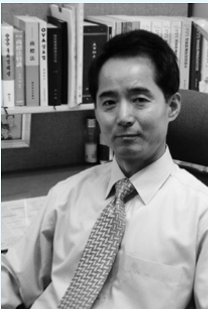
이 제 명 상표3심사팀장

이 사건 출원상표는 그 의미를 직감할 수 없는 단어들인 “SABREMAN”과 “STAMPEDE”가 결합되어 구성된 상표로서 “SABREMAN” 부분과 “STAMPEDE” 부분 사이가 떨어져 있어서, 각각 구성부분을 분리하여 관찰하면 거래상 자연스럽지 못하다고 여겨질 정도로 불가분적으로 결합된 것이라고 볼 수 없으므로(원고는, “크리스찬 디오르”나 “Bean Pole” 등의 유명상표가 결합된 상태 그대로 인식되고 호칭되듯이 이 사건 출원상표도 그와 같이 결합된 상태로 인식되고 호칭될 것이라고 주장하나, 이 사건 출원상표가 두 부분으로 띄어쓰기가 되어 있음에도 불구하고 일반수요자들이나 거래자들이 이 사건 출원상표를 반드시 두 부분이 결합된 상태로만