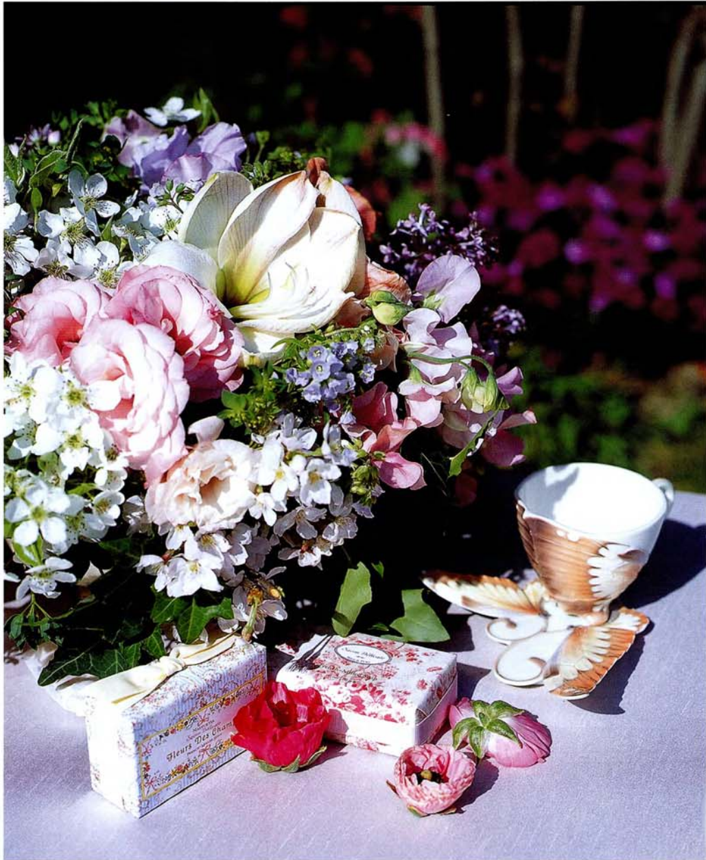
Setting of Happy present 연한 핑크빛 테이블 클로스에 나비 모양의 재미있는 찻잔 세트로, 조금은 여성스럽고 수줍은 듯한 오후의 다과 테이블을 꾸며보자. 여기에 너무 강렬하지 않은 컬러의 센터피스를 놓고 초대받은 사람들을 위한 작은 선물 상자로 테이블을 장식한다. 원색 계열의 컬러보다는 파스텔톤의 테이블 클로스를 깔아 테이블 웨어나 센터피스가 더욱 돋보이도록 한다. 본격적인 음식이 서빙되기 전, 파티 피플을 위한 배려가 엿보인다. 나비 모양의 찻잔과 선물 상자는 POM POM, 테이블 클로스는 Room-deco, 센터피스는 Lafête.