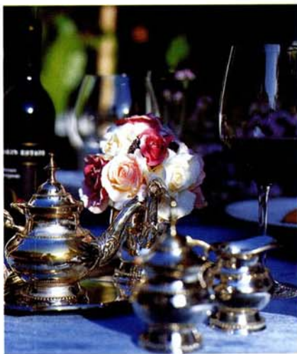
Simple Party Table 해가 서서히 저물어갈 무렵에는 정원에서 열리는 작은 파티가 한창 무르익는 시점이다. 스테이크, 쿠키, 카나페, 수프 등으로 포만감을 느끼는 파티 피플들을 위한 흥차 한잔의 여유. 바로 이 순간 느끼는 행복감이다. 앤티크한 영국풍 찻잔 세트, 테이블 클로스, 센터피스는 Lafête, 와인과 글라스는 Hephizibah, 접시는 Room-deco.