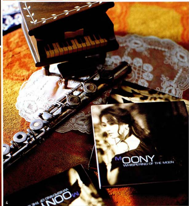
1 마치 공주가 금방이라도 침대에서 일어날 것 같은 다소 동화적인 침구류와 커튼. 2 런던 집에서 가지고 온 미니어처 백과 구두는 그녀가 아끼는 소품들이다. 생각가면서도 패션이나 리빙 아이템에도 관심이 많은 신문회 교수의 스타일을 알 수 있다. 3 미국에서 구입한 유명한 설치 작가의 작품과 멕시코에서 산 화병, 영국에서 가지고 들어온 장식장이 있는 한관 입구. 4 신문회 교수의 첫 번째 크로스오버 음반 <Moony>와 미니어처 피아노 소품.