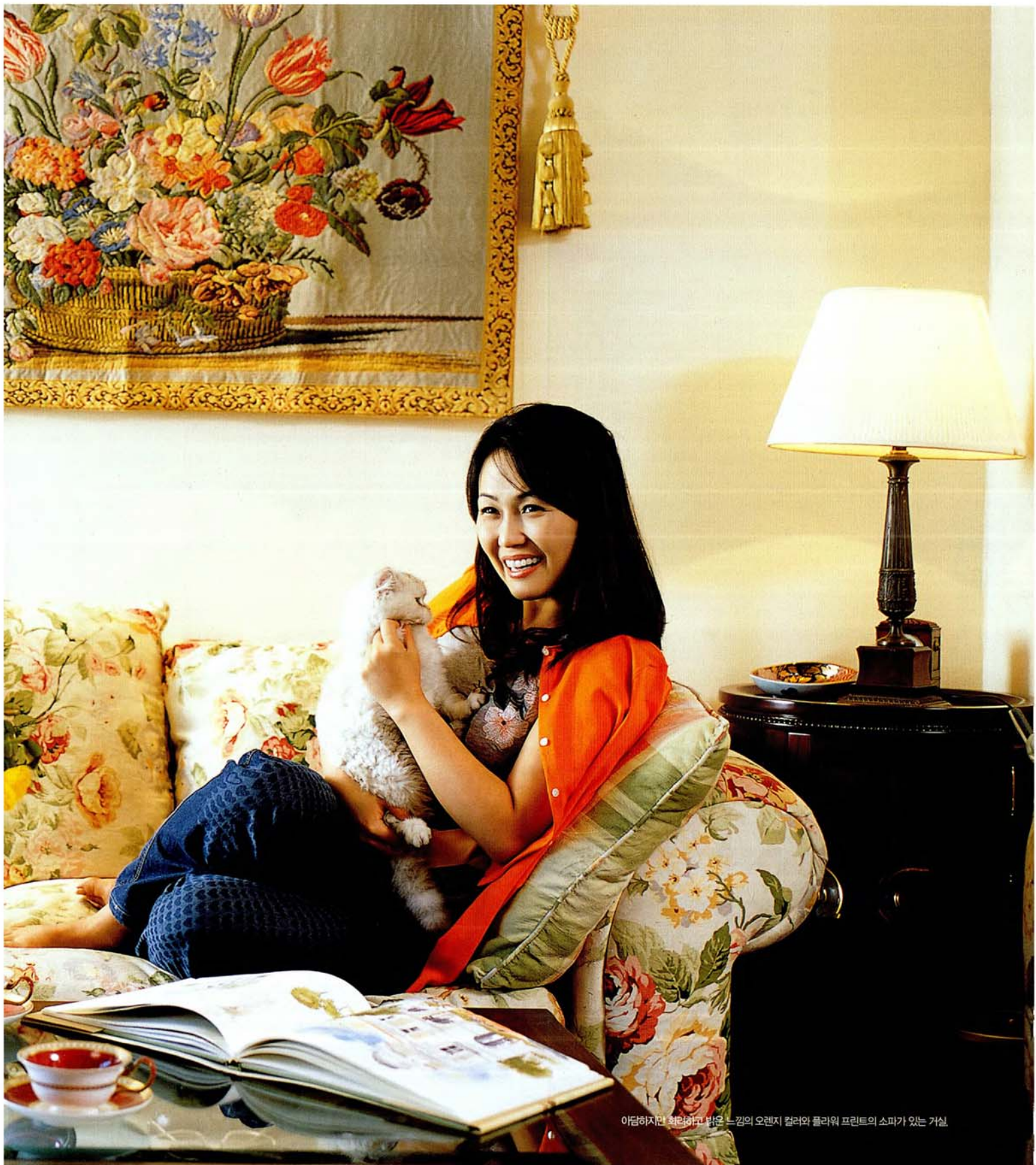
아담하지만 화려하고 밝은 느낌의 오렌지 컬러와 플라워 프린트의 소파가 있는 거실