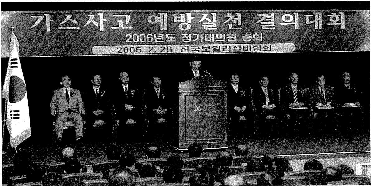
지난 2월28일 한국가스안전공사 가스교육원에서 가스안전사고예방 실천 결의대회 및 2006년도 정기대의원총회가 열렸다.

우리협회는 지난 2월28일 충남 천안시 목천읍에 위치한 한국가스안전교육원에서 전국대의원 250여명 내빈, 장학생, 협력업체관계자 50여명 등 300여명이 참석한 가운데 2006년도 가스사고예방실천결의와 정기대의원총회를 개최했다.