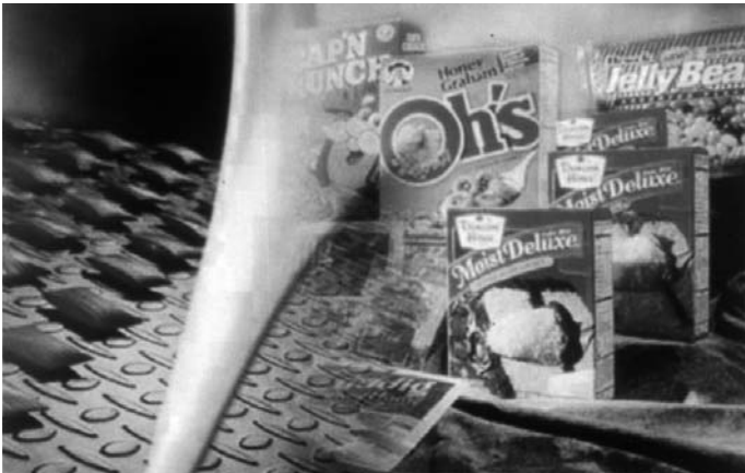
▲ 포장제품에 적용한 접착제 'ADVANTRA'를 적용한 제품

Window 단열용으로 복층유리 쉐던트, Thermal Barriers 단열 폴리 우레탄, 고효율의 복층 유리용 핫멜트가 있다.