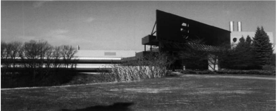
▲ H.B.FULLER 본사

일리지(사용량) 극대화, 넓은 영역의 완제품 적용 온도, 깨끗한 색상 및 무취의 장점, 연간 포장라인의 비용절감을 들 수 있다.