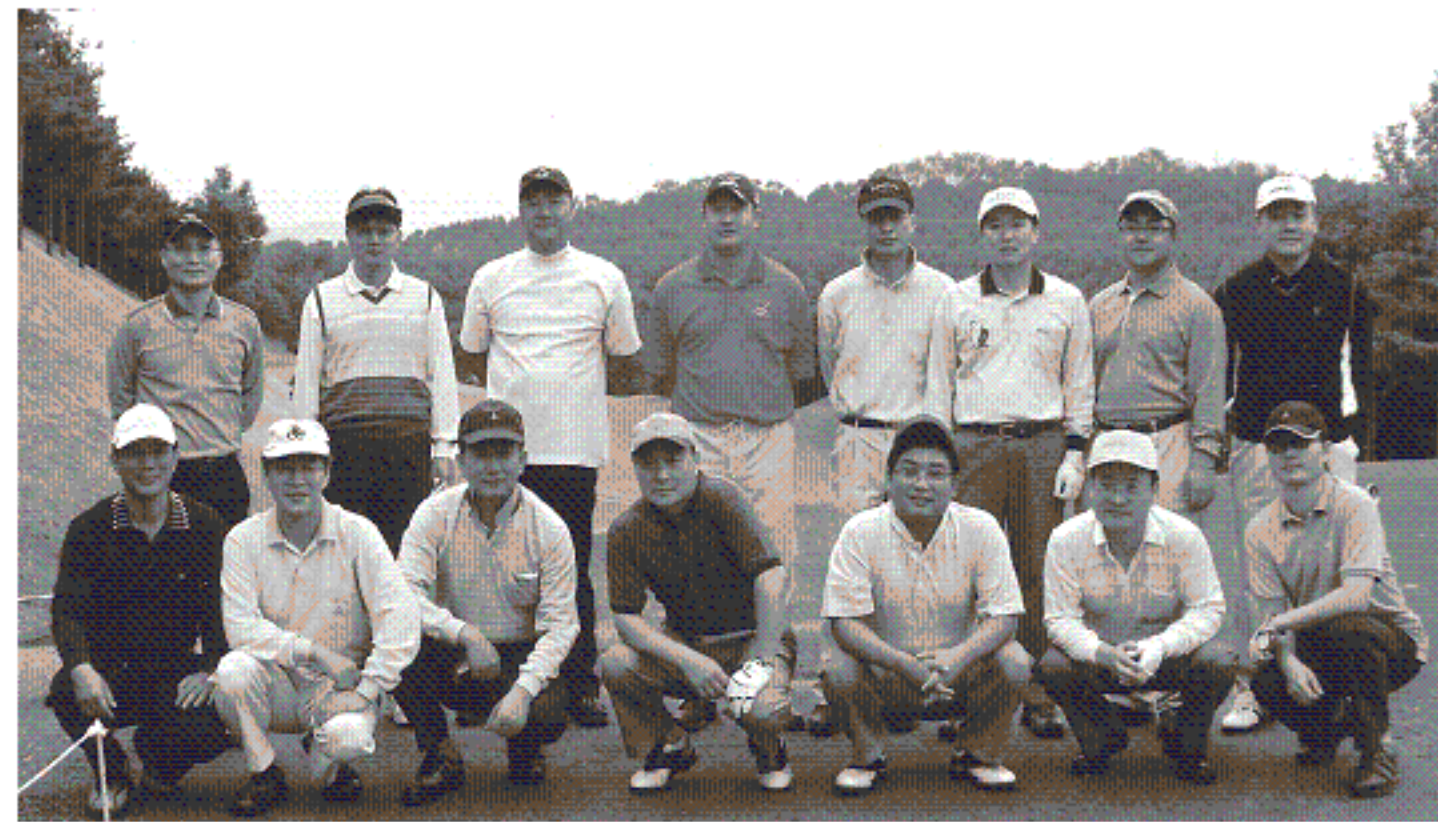
제18회 친선골프대회 사진

2006년9월26일 태광CC(용인)에서 회원사의 친선을 도모하기 위한 제18회 친선골프대회를 개최 하였습니다.