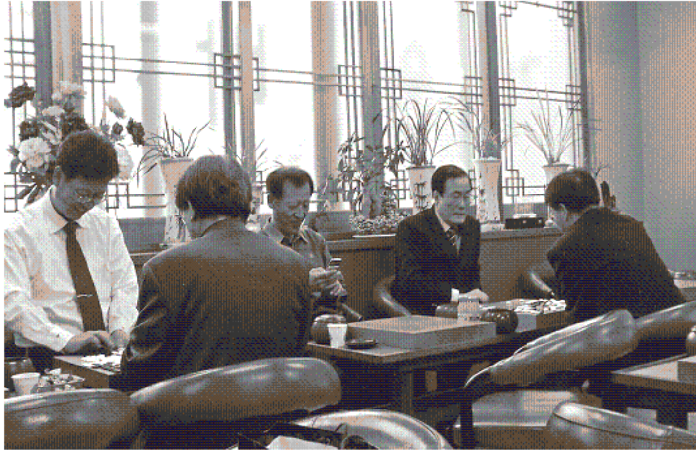
제3회 협회장배 바둑대회 사진

2006년11월23일 한성기원에서 회원사 및 관련업체(첨가제)의 대표자 및 실무자간의 유대강화와 업무협조를 통하여 업계간 공동이익을 증진 할 수 있는 단합의 기회를 마련하고자 제 3회 협회장배 바둑대회를 개최 하였습니다.