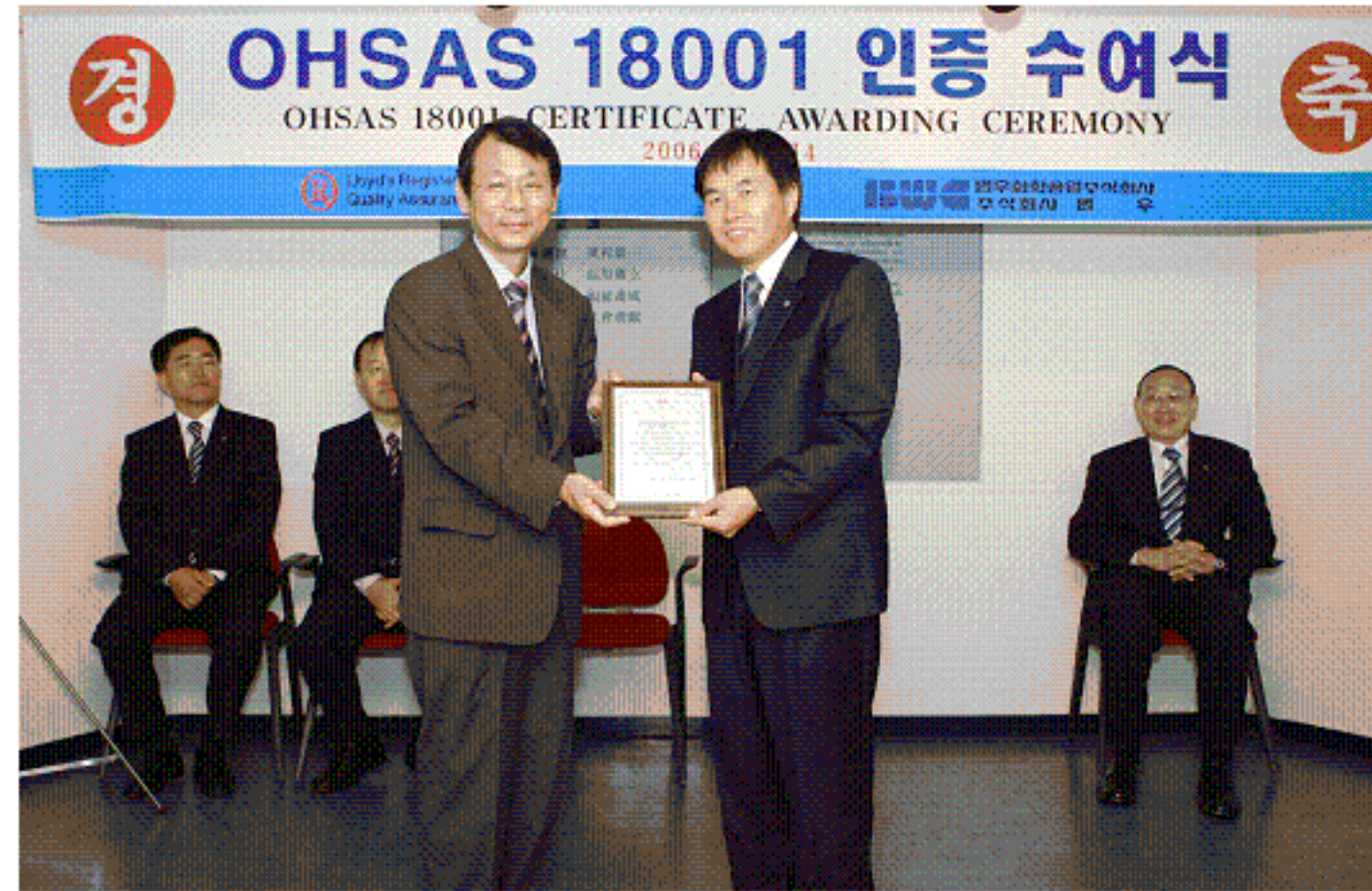
OHSAS 18001 인증 수여식

년 10월 14일 서울 본사에서 인증 기관인 LRQA로부터 인증 수여식을 가졌습니다.