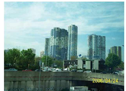
▲ 주거중심지구의 아파트