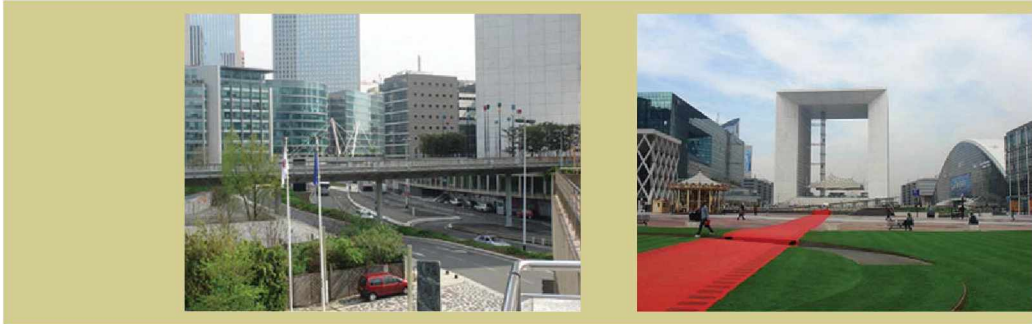
▲ 복층구조의 공간구성