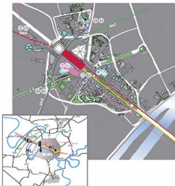
▲ 라데팡스의 대중교통 노선도

현재, 기업의 활동 및 문화공간의 활용 등으로 하루에 40만명이 넘는 방문객이 찾아오는 등 교통량이 지속적으로 증가하고 있어 이에 대해 다양한 교통수단의 도입 및 도로의 구조개선을 위한 노력이 추진되고 있다.