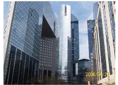
▲ 상업·업무중심지구의 고층건축물

라데팡스는 고층·고밀 개발임에도 불구하고 인공지반의 도입과 복층 구조라는 독특한 공간구성을 통해 넓은 오픈스페이스를 확보하고 있다. 즉, 인공지반을 통해 1층부는 도로, 철도, 지하철, 주차장 등 주요 교통 동선을 위한 용도로 활용하고, 2층부는 보행 전용공간으로 활용함으로써 넓은 오픈스페이스를 확보하였다. 그리고 이렇게 확보된 오픈스페이스에는 공원과 광장을 조성하여 도시의 쾌적성 향상과 다양한 활동을 담은 문화의 공간으로 활용하고 있다.