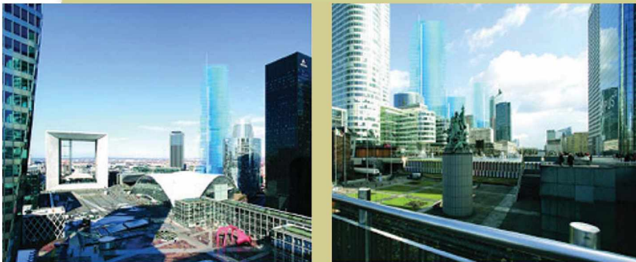
▲ 라데팡스의 중심광장의 모습(다양한 건축물과 조각품)

신개선문 뒤쪽에 인접한 퍼시픽타워는 건물의 중앙을 관통하는 주변 고속도로로 인해 보행자의 접근성이 제약되자 그 해결책으로 디자인된 것이다. 특히, 이 건물은 서양의 전통적인 흰 벽을 의미하는 흰색의 콘크리트와 동양의 나무와 종이로 만든 미달이문 등을 도입하여 도시환경과 건축, 그리고 동양과 서양의 공생을 표현한 건축물이다. 이러한 건축물과 함께 라데팡스 지역개발공사는 기업들의 기부금과 문화부의 지원을 통해 문화적 역동성을 부여하기 위해 유명 조각가들의 작품을 설치하여 라데팡스를 야외조각 전시장으로 만들었다.