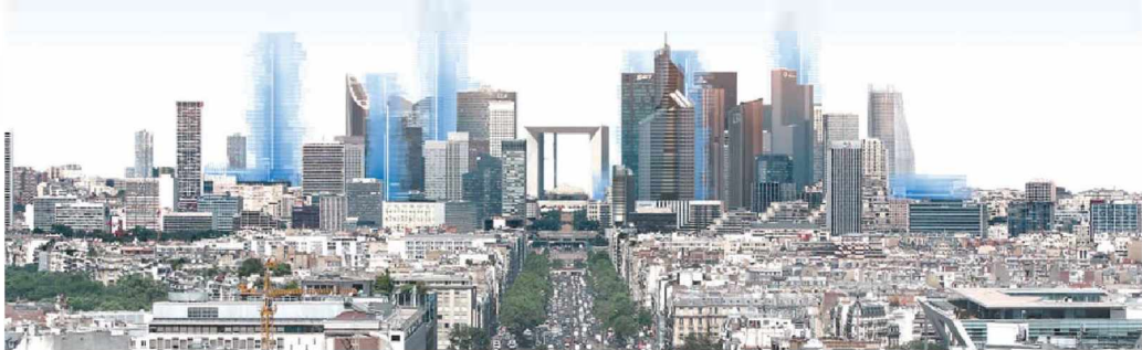
개선문에서 바라 본 라데팡스

파리 중심부에서 약 6km 정도 떨어진 라데팡스는 파리 서측 중심축에 상징적인 복합기능 시설을 개발하고자 하는 컨셉하에 건설되었다. 이러한 상징적 의미를 대표하기 위해 프랑스 혁명 2백주년 기념 물인 신개선문이 건립되었다. 이처럼 신개선문이 건설됨으로써 라데팡스는 「루브르박물관-콩코르드광장-상제리제거리-개선문-신개선문」으로 이어지는 '역사의 흐름'이라는 중심축 선상에 위치하게 되었다.