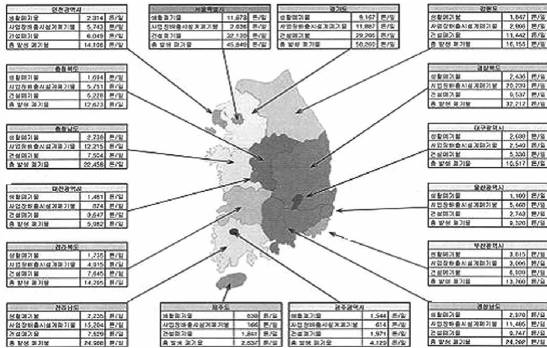
[그림 3] 지역별 폐기물 발생량(환경부, 2004)