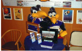
J 빌리지 상품관

페스티벌의 운영 등을 J빌리지가 수탁하여, 수입이 큰 폭으로 증가하였기 때문이다.