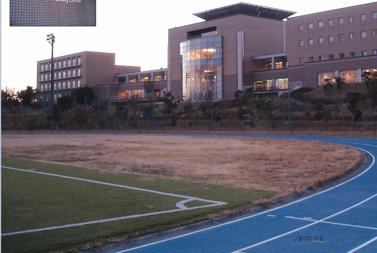
J 빌리지 전경