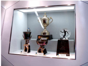
J빌리지 트로피 전시

현재 J 빌리지는 동경전력과 일본 축구협회, 후쿠시마현이 각각 전체 주식 중 10%씩의 지분을 가지고 운영되고 있으며, 그 이외의 지분은 후쿠시마현 내의 민간 회사들이나 각 시·