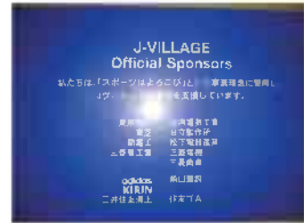
J 빌리지의 각종 스폰서