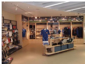
J빌리지 상품 판매관