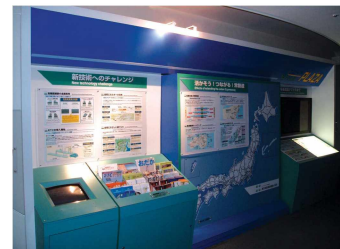
J 빌리지 홍보데스크