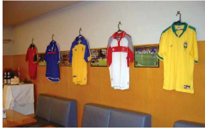
J 빌리지 상품관