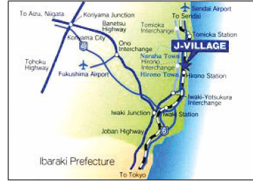
J 빌리지의 위치

이에 의하여 축구 대표선수들이 훈련할 수 있는 최고의 시설을 전국 각지에 조성하여 일본의 축구 수준을 격상시키려는 축구협회의 장기 계획이 J 빌리지 조성의 주요한 배경이 되었다.