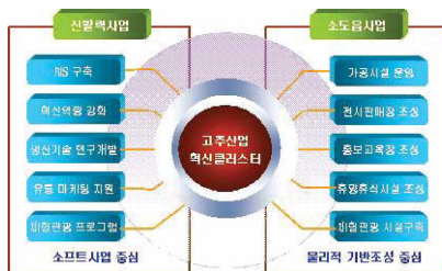
소도읍사업과 신활력사업의 연계방안

청양군은 낙후지역의 자립적 발전이 가능하도록 지역혁신역량을 강화하여 생동감 있는 활력지역을 만들어 전국의 균형발전을 도모하기 위해 선정된 신활력지역(국가균형발전특별법 제2조제5호상의 낙후지역)으로 2004년에 지정되었다. 청양군 신활력사업은 지역특성에 부합되고 지역의 활력을 창출하여 소득창출 효과가 큰 사업을 중심으로 선택과 집중원칙에 의거하여 지역혁신협의회 등 관련 전문가와의 충분한 협의를 거쳐 선정되었다. 청양군 신활력사업에서는 지역농업을 중심으로 산 학 연 관이 유기적으로 연계되는 지역혁신체계(RIS) 확립과 청양을 대표하는 7가지 농산물(청양고추, 구기자, 배본, 토마토, 밤, 표고버섯) 중에서 청양고추를 명품화하기 위한 사업을 우선적으로 추진하는 것을 주요내용으로 담고 있다.