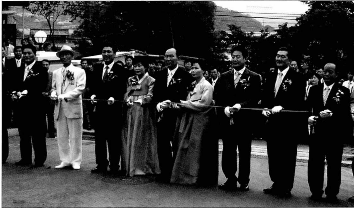
지난 7월4일 열린 백산하이테크 신사옥이전식에서 테이프커팅을 하고 있는 모습