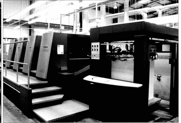
국내 두번째로 도입한 하이델베르그사의 스피드마스터 XL 105