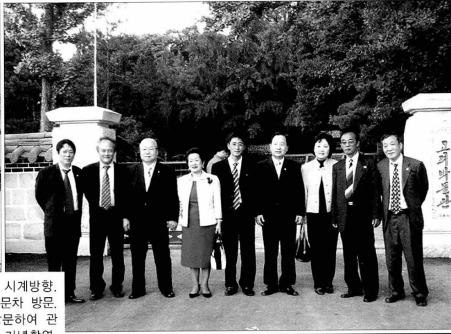
왼쪽부터 시계방향, 군부대 위문차 방문. 개성을 방문하여 관계자들과 기념촬영. 사회복지시설을 방문하여 위문품을 전달. 연변조선족 위문방문.