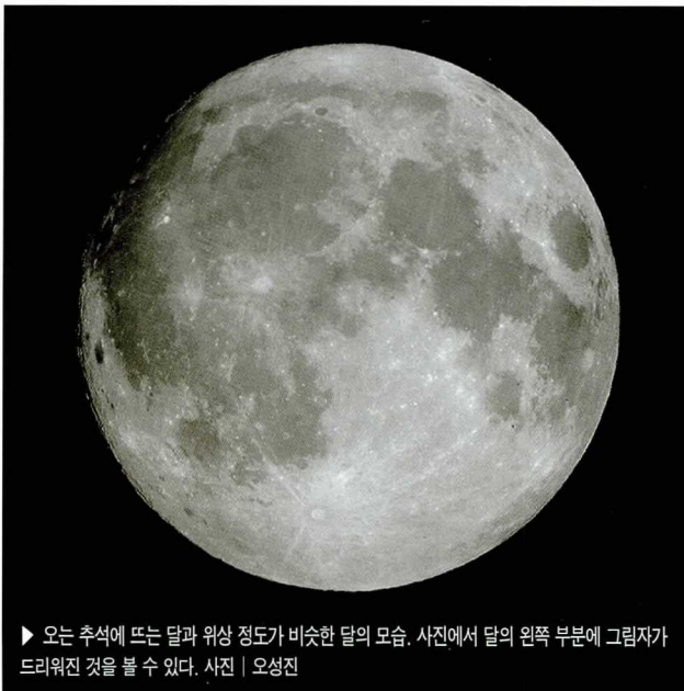
▶ 오는 추석에 뜨는 달과 위상 정도가 비슷한 달의 모습. 사진에서 달의 왼쪽 부분에 그림자가 드리워진 것을 볼 수 있다.

오는 10월 6일(음력 8월 15일)은 설과 함께 민족 최대 명절인 추석이다. 이날 저녁, 동쪽 산너머로 얼굴을 내미는 둥근 보름달을 보며 저마다의 소원을 빌 것이다. 그런데 천문학적으로 가장 둥근 달(망)은 추석이 아닌 그 다음 날에 뜬다. 추석 저녁에 뜨는 달은 보름에 뜨니 보름달은 맞지만 우리가 생각하는 완전히 둥근 의미의 보름달은 아닌 것이다. 왜 그럴까? 달이 차고 기우는 것(위상 변화)은 지구를 공전하면서 태양-지구-달의 상대적인 위치가 변하기 때문이다. 이렇게 달이 차고(망) 기울었다(합삭) 다시 찰 때(망)까지의 시간을 삭망월이라 하는데, 대략 29일 12시간 44분이다. 그런데 음력 한 달은 29일과 30일 섞여 있어 삭망월과 비교하면 조금 길거나 짧다. 이런 차이로 인해 망은 음력 15일일 수도 있지만, 그 전날, 또는 그 다음 날에 올 수도 있는 것이다. 올 추석 저녁에 달은 17시 36분에 뜨며 위상은 0.991이다. 위상이 1이 되는(완전히 둥근) 망 시각은 7일 12시 13분이고, 이날 월출 시각은 18시 4분이다. 이때 위상은 0.999로 추석 때보다 조금 더 둥근 달을 볼 수 있다.