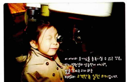
▶ Global-IMC 2006 e-포스터 우수상 수상작

우리 연구원의 혁신 전략팀에서 기획하고 전산팀에서 매주 제작되어 그룹웨어 로그인 화면에 게시되고 있는 e-포스터가 한국표준협회에서 주최한 Global-