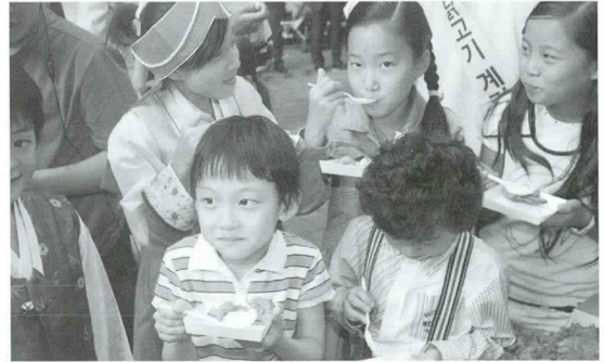
▶ 계란·닭고기 요리를 맛있게 먹고 있는 아이들