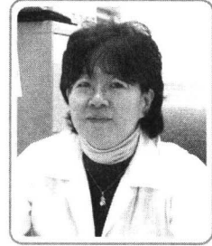
이 강 숙 가톨릭대학교 보건의대학원

우리의 현재와 미래의 풍요로운 삶은 국가 경제의 전반적인 생산성에 달려있다 해도 과언이 아니다. 지속적인 혁신과 가치창조에도 불구하고 꾸준한 생산성 향상이 없이는 가능하지 않을 것이다. 조직체에서의 성과는 주로 생산성과 관련된 업무상의 가시적 결과나 또는 업무수행상의 효율성으로 흔히 이해되고 있다. 생산성이란 투입(자원과 시간)과 결과(생산품, 서비스, 지식 등)와의 관계로 주어진 단위 시간 내에 경제적인 가치 및 제품과 서비스의 질을 의미한다.