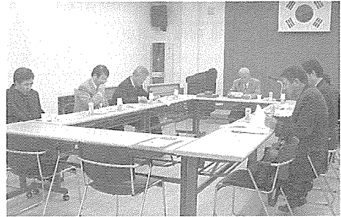
▲ 제155차 정기이사회

우리협회는 지난 11월 15일 오전 11시 협회 대회의실에서, 제28차 정기총회에 앞서 제155차 정기이사회를 개최하고 정기총회 개최에 따른 안건 및 기타 당면문제에 대해 논의했다.