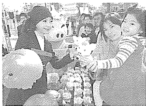
일반 소비자들에게 배포했다.

양돈자조금 관리위원회(위원장 김건태)는 10월 31일 제 43회 저축의 날을 맞아 돈돈이 캐릭터 모형의 돼지저금통을