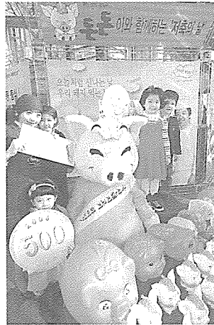
뜨거운 호응을 얻었다.

양돈자조금 관리위원회(위원장 김건태)는 10월 31일 제 43회 저축의 날을 맞아 돈돈이 캐릭터 모형의 돼지저금통을