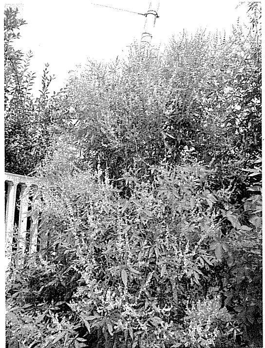
칠곡군 박명우 분회장이 금년봄에 식재한 헛개나무, 옴나무