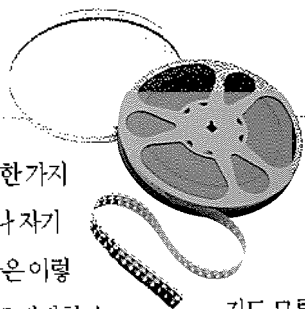
*사진은 영화 속의 장면입니다.

글 | 김 신 혜 · (아주 특별한 외출 - Summer Snow) 시나리오 / 감독