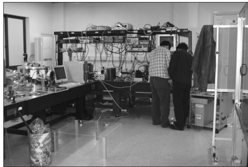
▶연구실험실에서 연구원들이 측정 장비로 실험을 하고 있다.

저국소증착으로 회로수정을 가능케 하는 기술인 레이저국소증착 기술을 LG전자와 공동 개발하여 LG전자에 제공한바 있다.