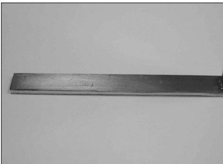
▶레이저 에칭을 통해 제조된 마이크로 히트파이프 (크기: 폭 5mm × 길이 56mm × 두께 1.5 mm)

다양한 연구분야중에서도 레이저에칭은 최근 IT 산업의 발전에 따른 휴대용 전자기기의 활용이 극대화되면서 관심이 고조되고 있는 기술이면서 본 연구소에서도 중점 연구분야이기도 하다. 레이저에칭은 기존의 다른 기술로는 가공이 힘든 고세장비의 홈 및 구멍가공을 위해 시편을 에칭용액 속에 담근 상태에서 레이저를 조사하여 가공하는 기술로서 특히 미세한 금속구조물을 가공하는데 유리하다.